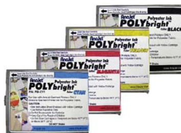
Cartouches d'encre Polybright pour polyesters et autres tissus synthétiques.