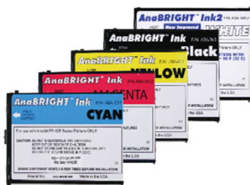
Cartouches d'encre Anabright pour cotons.

Spécifications sujettes à modifications sans préavis - Données non contractuelles